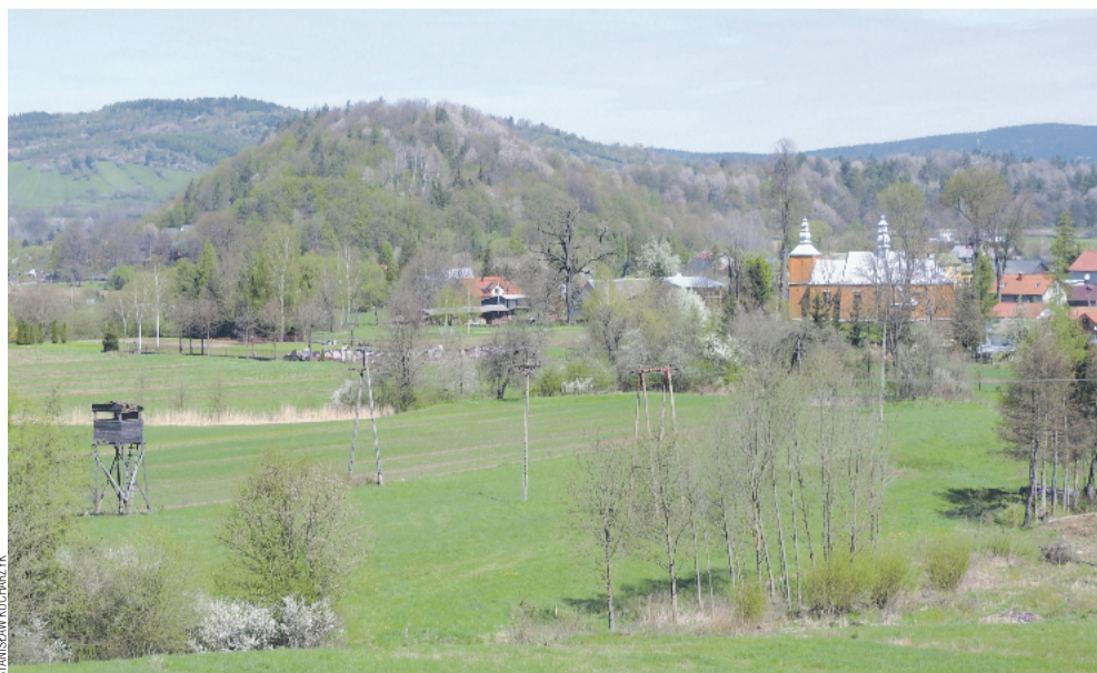
Widok na Tyrawę Solną i Diabłą Górę z wczesnośredniowiecznym grodziskiem

ko jako przyprawa, ale przede wszystkim do konserwacji żywności, a jej wydobycie i handel przynosiły znaczne dochody. W średniowieczu obowiązywało tzw. regale solne – królewskie prawo do eksploatacji złóż. W Tyrawie Solnej funkcjonowała żupa, czyli zakład warzenia soli z naturalnej solanki. Najstarsze wzmianki o niej pochodzą z XV w., lecz ślady archeologiczne wskazują, że sól pozyskiwano tu już około 800–900 lat p.n.e.