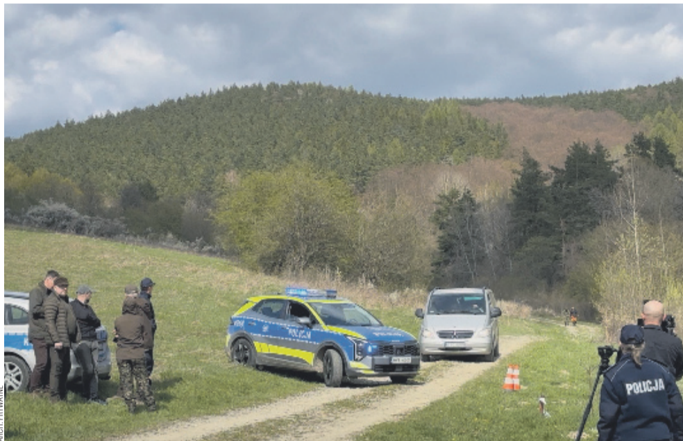
Do zdarzenia doszło w Płonnej (gmina Bukowsko) w rejonie wzniesienia Żurawinka

Eksperti podkreślali, że niedźwiedź brunatny nie traktuje człowieka jako ofiary łownej i zwykle unika kontaktu