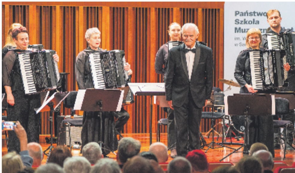
Wileńska Orkiestra Akordeonowa „Consona”

Państwowa Szkoła Muzyczna I i II stopnia oraz Sanockie Towarzystwo Muzyczne składają gorące podziękowania wszystkim sponsorom i partnerom VI Międzynarodowej Wiosny Akordeonowej „Sanok 2026”.