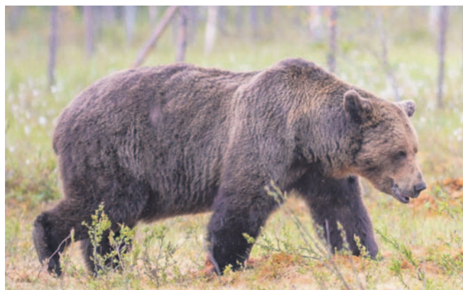
Niedźwiedź brunatny. Zdjęcie ilustracyjne

Podobne obawy wybrzmiały w Zagórz. W dzielnicy Wielopole Konfederacja zorganizowała konferencję prasową tuż obok przedszkola, przy którym pojawiły się niedźwiedzie.