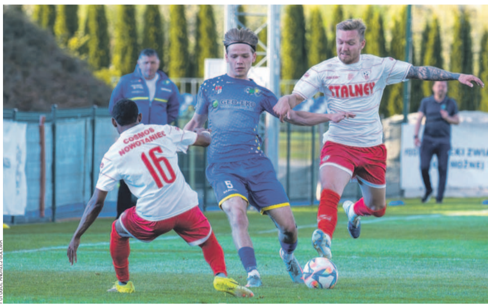
Tym razem piłkarze Cosmosu byli zdecydowanie lepsi od stalowców

Półtora miesiąca po ligowym zwycięstwie nad Cosmosem liczyliśmy na powtórkę w finale pucharowych rozgrywek podokręgu Krosno, jednak tym razem rywale okazali się lepsi i to w sposób bezapelacyjny. Wynik dobrze oddaje ich dominację w tym spotkaniu.