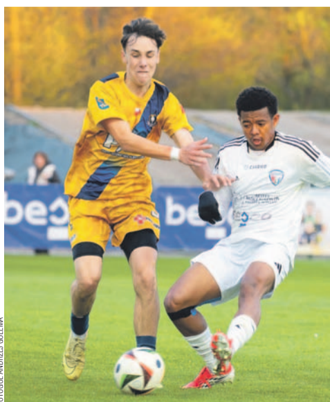
Wikingowie musieli uznać wyższość Grabówki